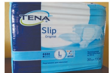
Продаются подгузники для взрослых, размер "L," (объем талии/бедер до 150 см), с полным влагопоглощением не менее 2000 г. Цена 1 упаковки (30 шт.) - 1 000 руб. В наличии 9 упаковок. Тел: 8-996-384-68-93, 8-914-569-90-00

СРОЧНО ПРОДАЕТСЯ гараж в центре города, возле дома по ул. Красноармейская, 25. Площадь 64 кв.м, на 3 автомобиля. Смотровая яма, погреб, электрифицирован, высокие ворота. Тел. 8-914-395-50-66