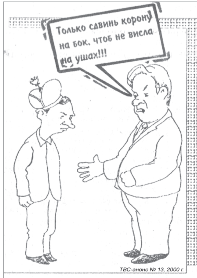
ТВС-анонс № 13, 2000 г.