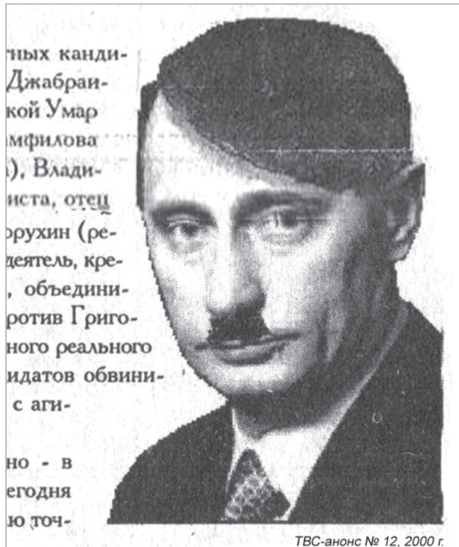
ТВС-анонс № 12, 2000 г.